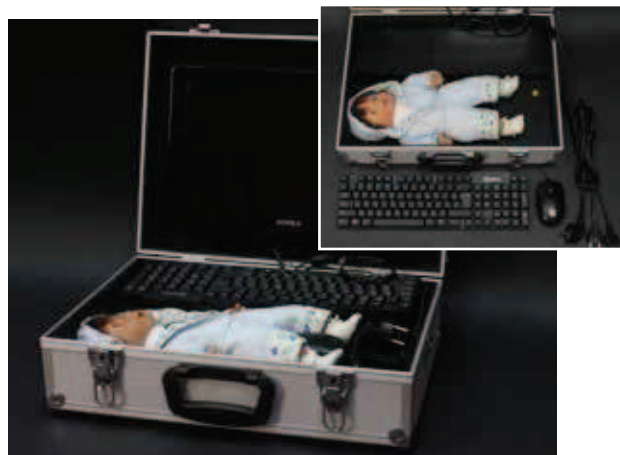
Илл.1. Внешний вид аппаратно-программного комплекса

Конструктивное решение выполнено в виде переносного компактного варианта, размещенного в кейсе. Внутри кейса находится манекен - силиконовая кукла, соответствующая по размерам грудному ребенку, блок генерации изображения и оптический блок, соединенные с компьютером пользователя (илл.1).